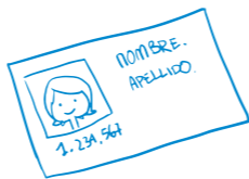
Fotocopia de cédula de identidad de la madre.