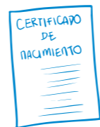
Copia de certificado de nacimiento del niño niña o adolescente.