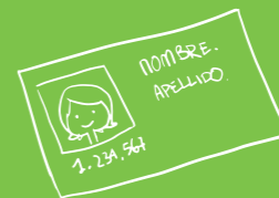
Fotocopia de cédula de identidad