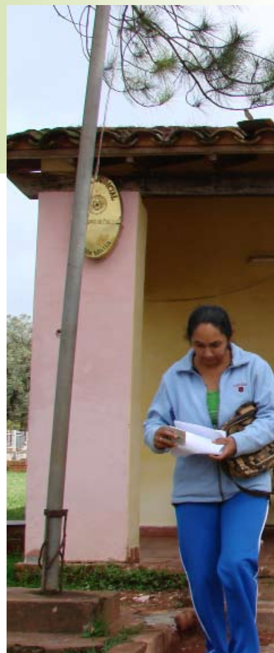
Local del Juzgado de Paz de Santa María de Fe.