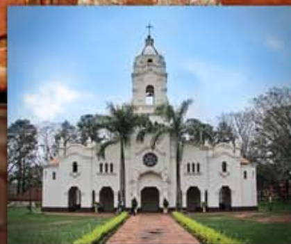
Misiones en imágenes