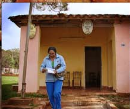
Conociendo los Juzgados de Paz de Misiones