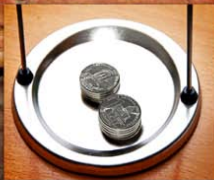
Experiencia administrativa sobre el presupuesto por materia jurídica en Misiones